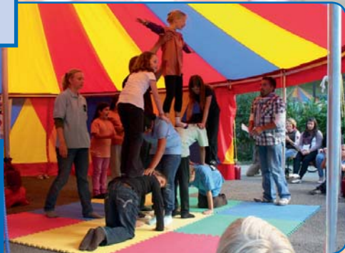
● Aufbau und Pflege von Kontaktnetzen in der Lebenswelt der Jugendlichen und zwischen verschiedenen lokalen Institutionen