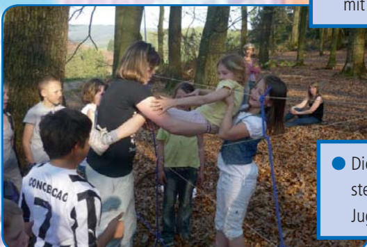
● Die Mitarbeiter/Innen des Jugendmobils stehen jederzeit für die Sorgen und Nöte der Jugendlichen zur Verfügung