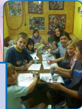
● Im Innenbereich ist Platz für Gespräche, Playstation, aber auch für Gesellschaftsspiele und Musik