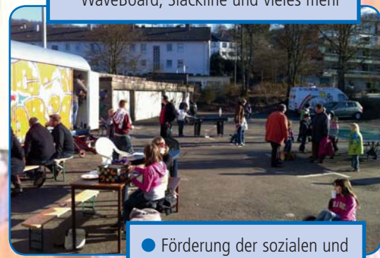
● Förderung der sozialen und kulturellen Kompetenzen