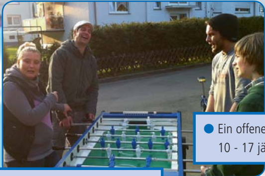
● Ein offenes Angebot für alle 10 - 17 jährigen Jugendlichen