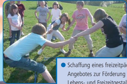
● Schaffung eines freizeitpädagogischen Angebotes zur Förderung der aktiven Lebens- und Freizeitgestaltung